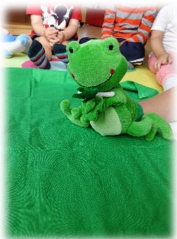
Geschichtensäckchen: „Der Frosch und die Fliege“